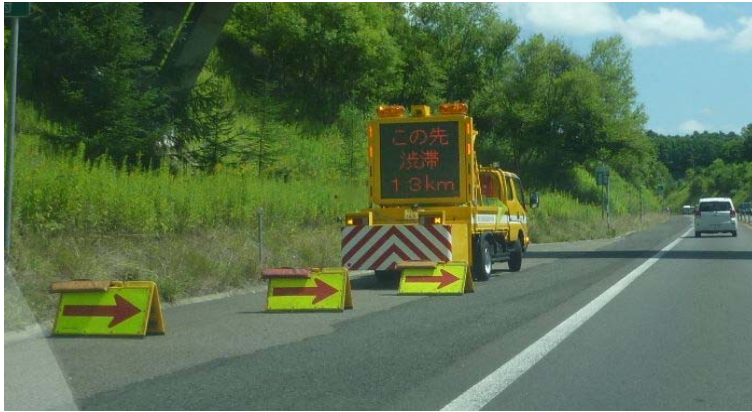
標識車による渋滞情報の提供