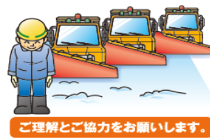
ご理解とご協力をお願いします。

除雪作業中は低速走行となり、追い越しはできませんが、一定時間ごとに除雪作業を中断し、後続のお客さまの車を優先できるよう、除雪車両を道路脇に退避させています。