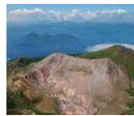
洞爺湖有珠山ジオパーク

ジオパークとは、「地球・大地(ジオ:Geo)」と「公園(パーク:Park)」とを組み合わせた言葉で、「大地の公園」を意味し、地球(ジオ)を学び、丸ごと楽しむことができる場所をいいます。大地(ジオ)の上に広がる、動植物や生態系(エコ)の中で、私たち人(ヒト)は生活し、文化や産業などを築き、歴史を育んでいます。ジオパークでは、これらの「ジオ」「エコ」「ヒト」の3つの要素のつながりを楽しむことができます。