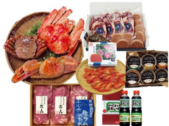
「三大ガニセット」など豪華賞品が 抽選で326名様に当たる！