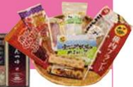
稚内ブランド商品

下記の中から、いずれかの賞品をプレゼント！ ※北海道の魅力発見賞の賞品は選びいただけません。