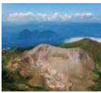
洞爺湖有珠山ジオパーク