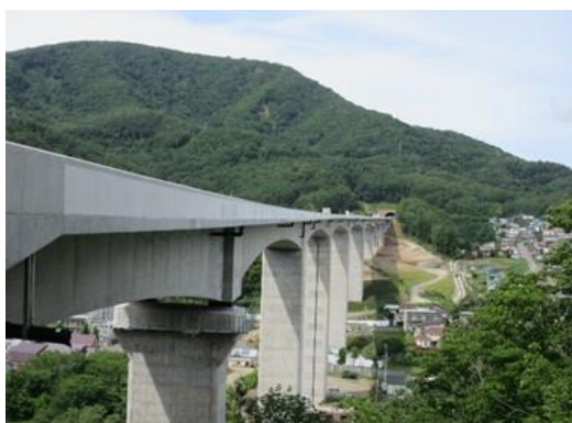
後志自動車道 天神橋

NEXCO東日本北海道支社(札幌市厚別区)は、平成30年度に完成した工事等のうち、その施工や取り組みが特に優秀だった受注者を以下のとおり表彰します。