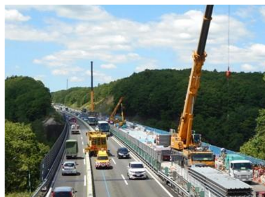
道央自動車道 島松川橋

優秀工事等の表彰は、その功績を表彰することにより、更なる品質等の改善や調査等業務における技術の向上に資することを目的としています。