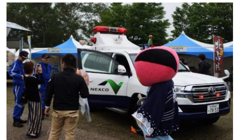
【高速道路パトロールカーも展示します】 (一部会場のみ)