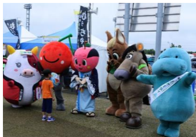
【ご当地キャラも大集合】