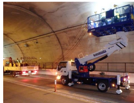
トンネル照明設備更新工事例