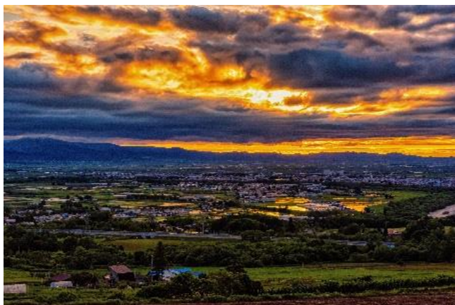
【高速道路のある風景部門 最優秀賞】