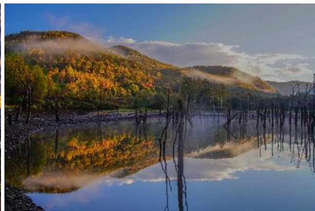
【北海道の四季部門 最優秀賞】

NEXCO東日本北海道支社(札幌市厚別区)は、今年2～5月に募集していた「第10回 北海道の四季フォトコンテスト」の審査を行い、最優秀賞2点ほか合計13点を選定しました。