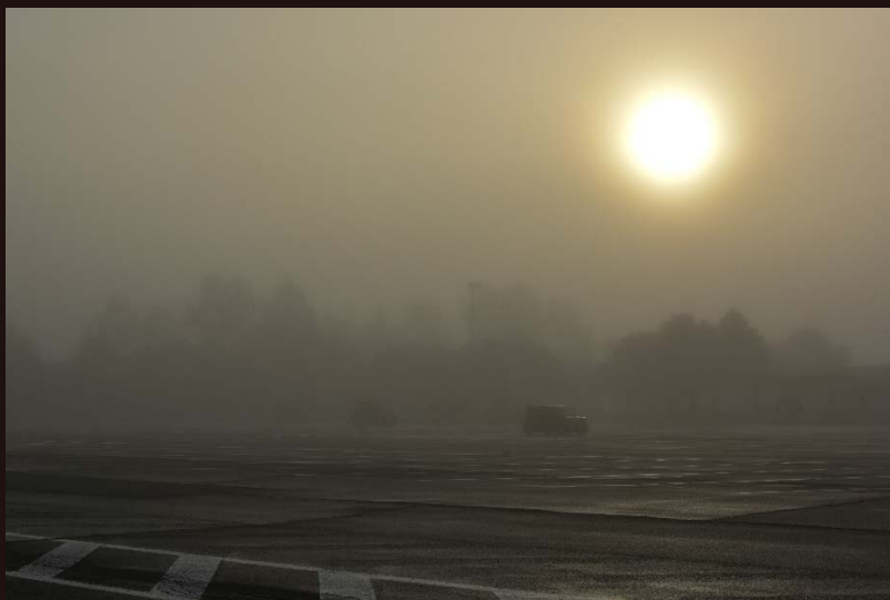
道央道/樽前SA/10月撮影