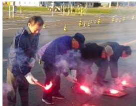
発炎筒の着火体験