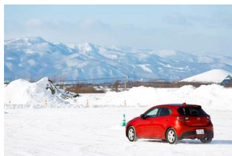
【冬道を実走しての講習を行います】