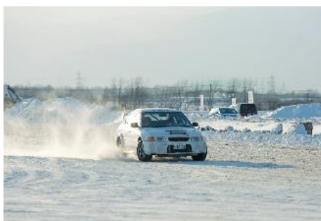
【車の動きや対処方法を学びます】