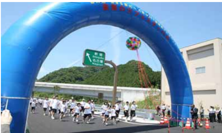
八王子西ICへ到着した「未来の火リレー」