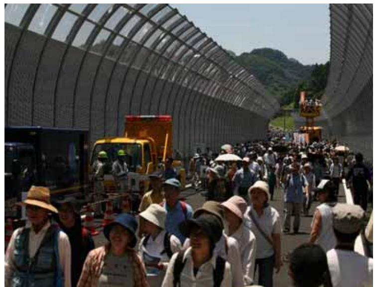
大盛況の圏央道ウォーキング