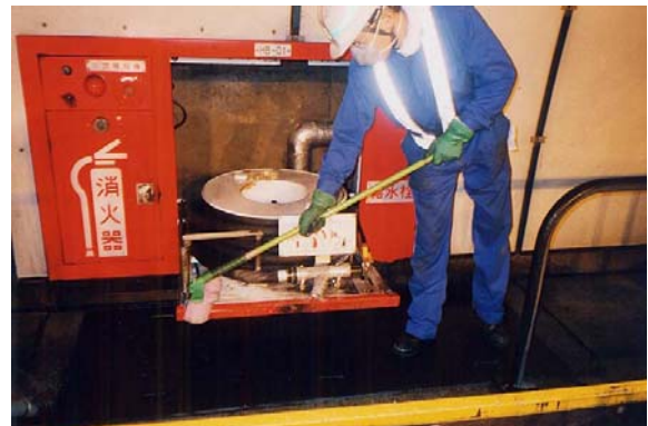
非常用設備清掃・点検