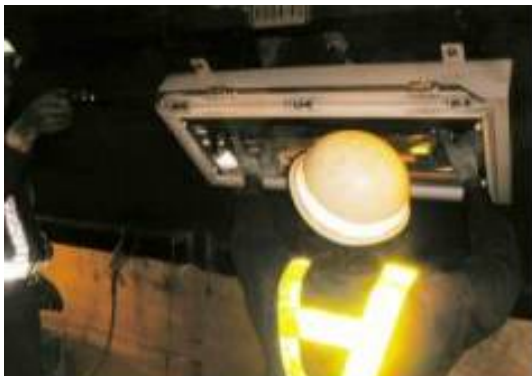
トンネル照明設備清掃・点検