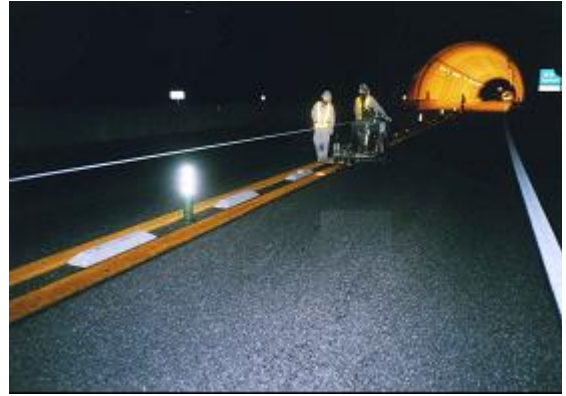
路面標示工の設置