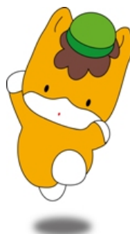
ぐんまちゃん(群馬県)