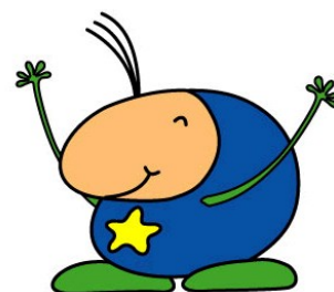
海ほたるくん(海ほたる)