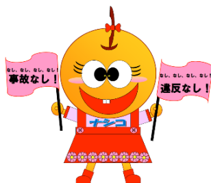
幸水ナシコ(NEXCO 東日本)