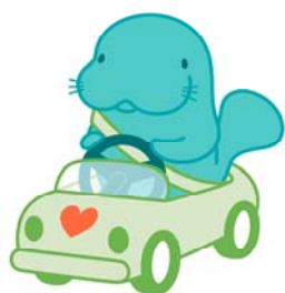
マナーティ(NEXCO 東日本)