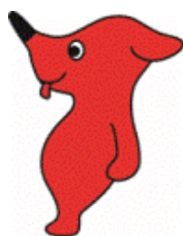
チーバくん(千葉県)