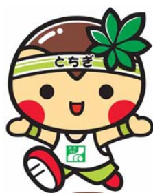
とちまるくん(栃木県)