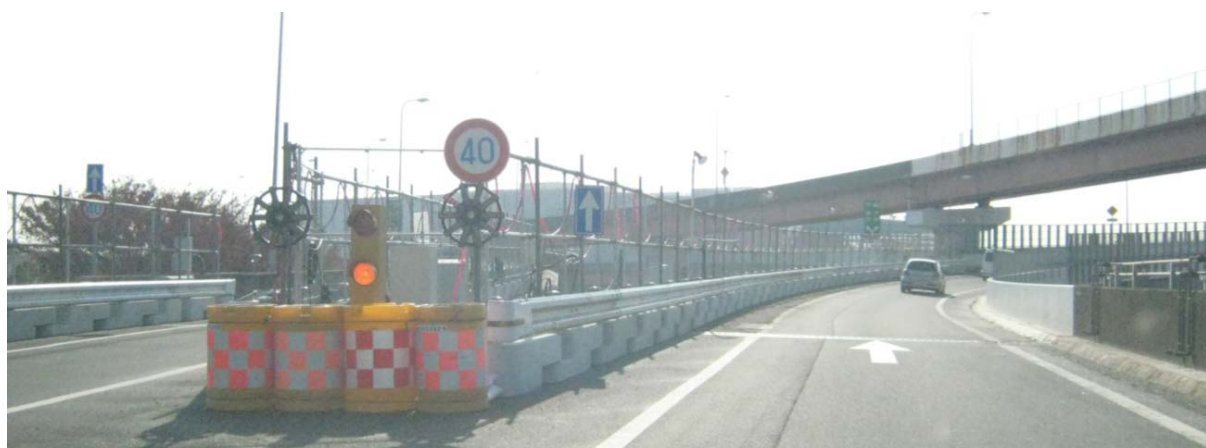
拡幅工事状況写真(ランプ道路上より)