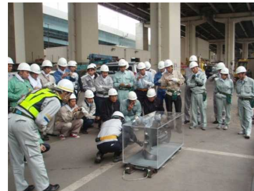
技術講習会の実施状況