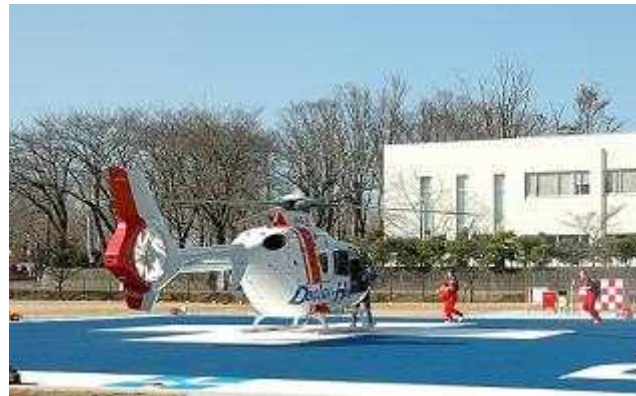
防災ヘリ・ドクターヘリ(イメージ)