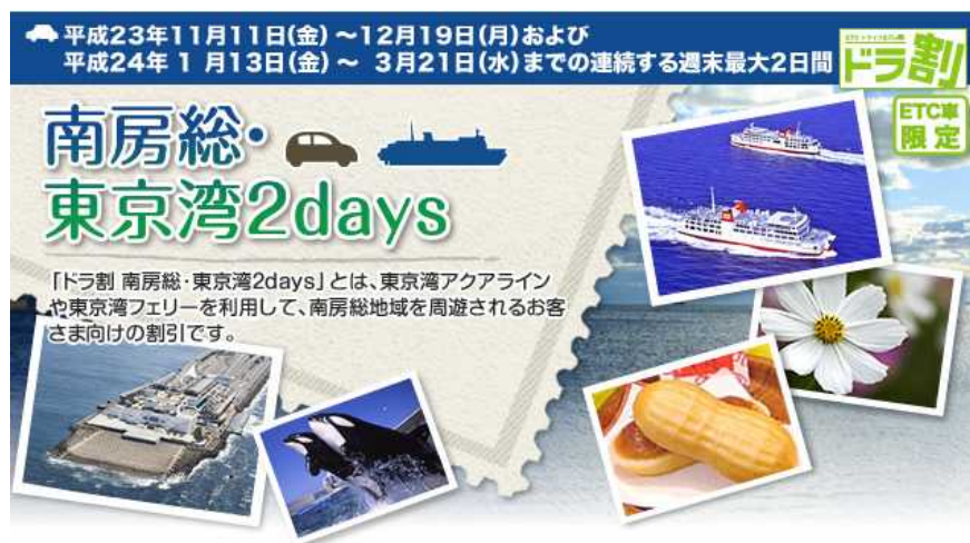
企画割引 (南房総・東京湾2Days)