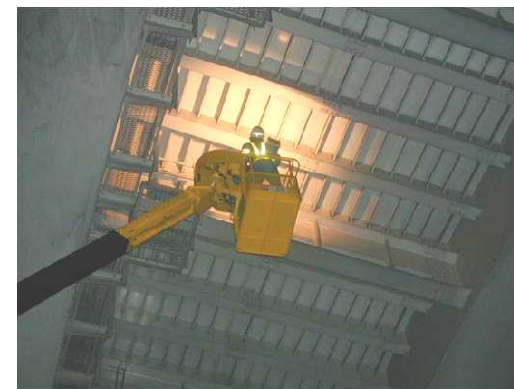
橋梁点検の実施状況