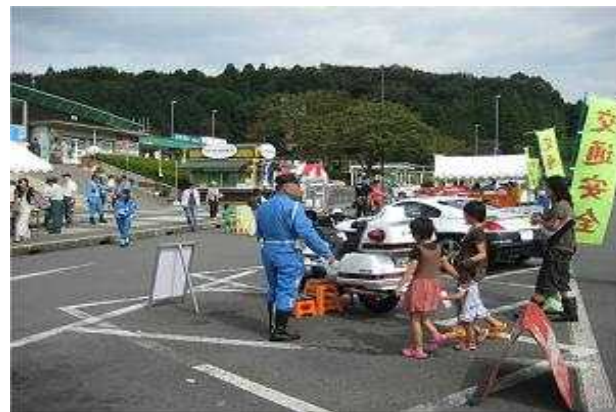
交通安全啓発活動