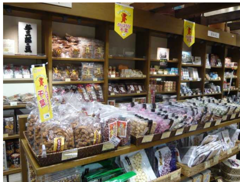
千葉県産品の販売 (京葉道路 幕張PA)