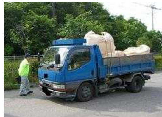
不法投棄に関する点検・指導(イメージ)