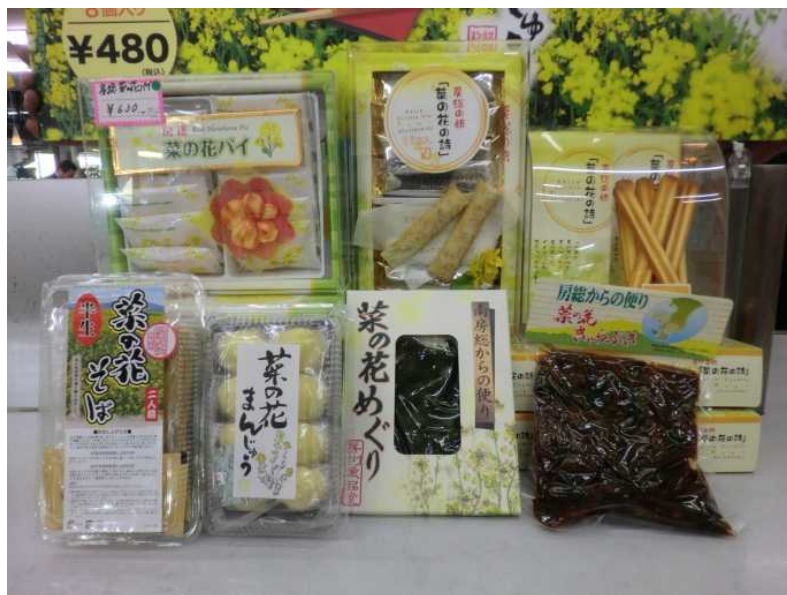
千葉県産品の販売 (首都高湾岸線 市川PA)