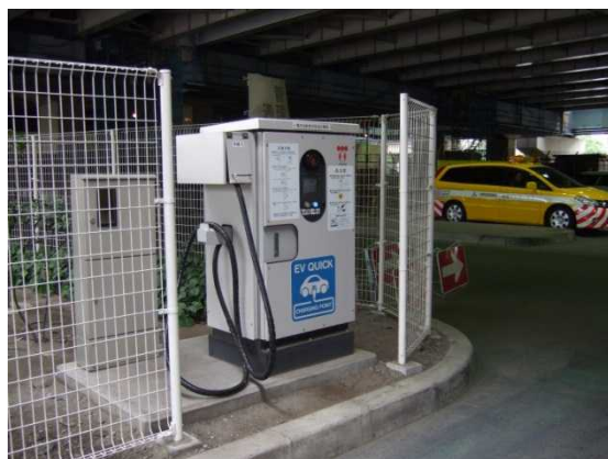
電気自動車用急速充電器の設置 (首都高湾岸線 市川PA)