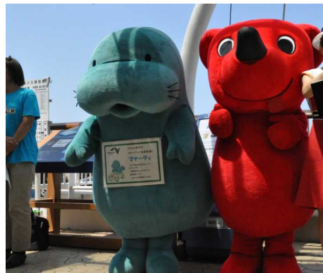
SA・PAでのイベント (サマーフェスティバルin海ほたる)