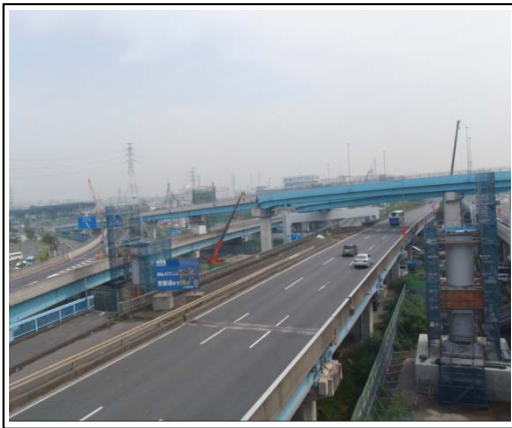
(参考写真)国道 357 号通行止め箇所(右図)

また、通行止めは、交通量の少ない時間帯(23 時～翌朝 4 時まで)とし、沿道ならびに国道 357 号をご通行のドライバーの皆様への影響を最小限にするために、作業集約化による通行止め回数の削減・作業時の騒音低減を図り工事を進めております。