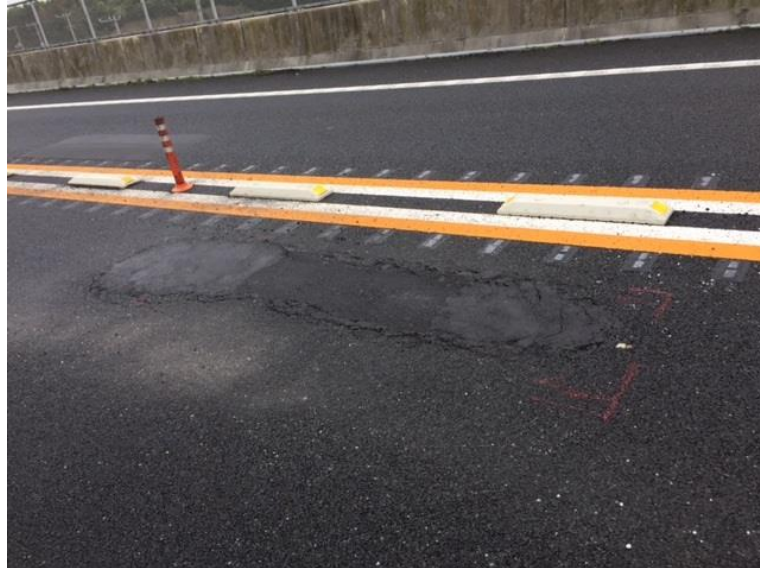
東関東道 路面状況例