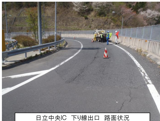
日立中央IC 下り線出口 路面状況

日立中央IC 下り線出口は、舗装の劣化が進行しているため、補修工事を実施します。この工事は、車線の幅が狭い部分で、「舗装の撤去、舗装の再敷設」などを一連の作業として行います。そのため、やむを得ず出口を閉鎖して作業を行う必要がありますが、お客さまへ極力ご迷惑をおかけしないよう、交通量が最も少ない夜間に、工事を集中的かつ効率的に実施します。