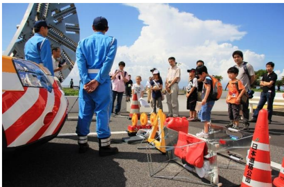
【道路パトロールカーの体験試乗】