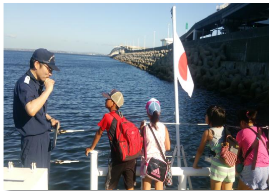
【巡視艇「たかたき」の船内見学】