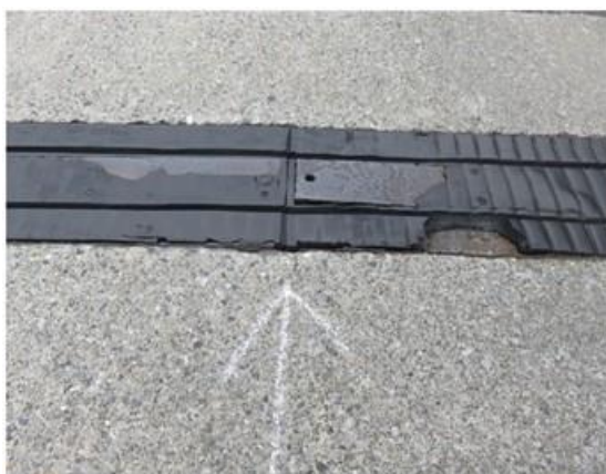
表面ゴムの剥れ、鉄板露出