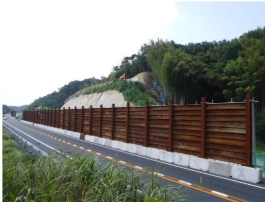
落石防護柵の撤去前

館山自動車道(君津～富津竹岡)の4車線化工事に伴い、供用路線の安全対策のために設置した落石防護柵及び仮設ガードレール・目隠しネットは、工事進捗に併せ一部撤去を行います。