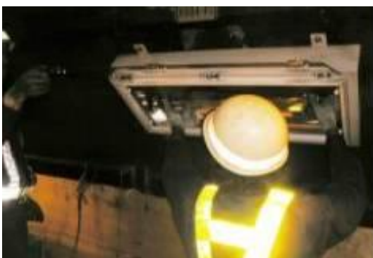
トンネル照明設備清掃・点検