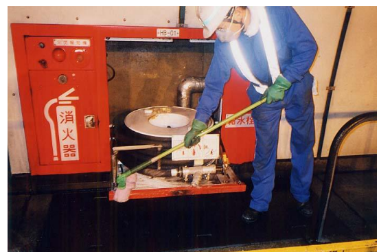
非常用設備清掃・点検