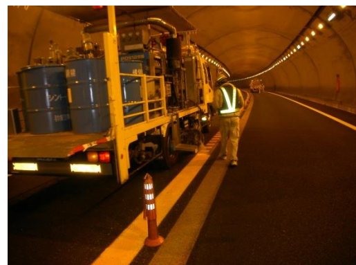
路面標示工の設置