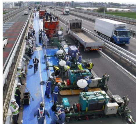
写真 鋼繊維補強コンクリート施工状況