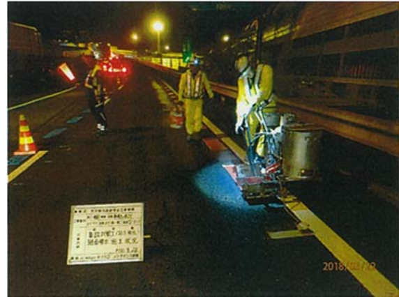
レーンマーク補修工事 作業状況