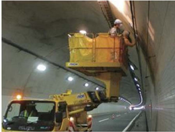
トンネル点検 作業状況写真

そのため、お客さまへ極力ご迷惑をおかけしないよう、交通量が少ない平日の夜間に出口の閉鎖を行い、工事を集中的かつ効率的に実施します。安全・快適に高速道路をご利用いただくために必要な工事ですので、ご理解とご協力をお願いします。