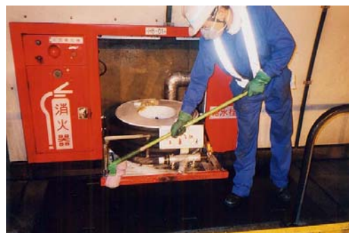
非常用設備清掃・点検