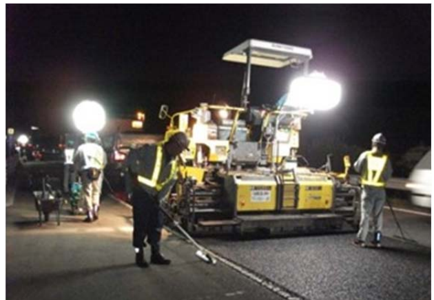
夜間舗設作業状況