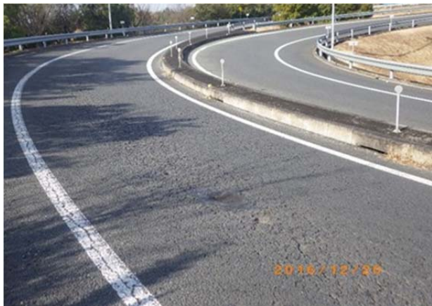
壬生IC 現況舗装状況

そのため、お客さまへ極力ご迷惑をおかけしないよう、交通量が少ない平日の夜間にランプの閉鎖を行い、工事を集中的かつ効率的に実施します。安全・快適に高速道路をご利用いただくために必要な工事ですので、ご理解とご協力をお願いします。