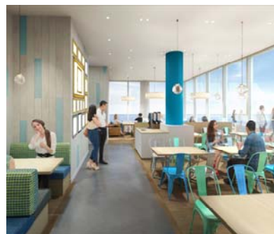
海側の座席（イメージ）