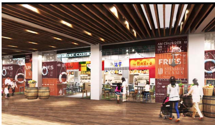
フードコート入口（イメージ）

NEXCO東日本東京湾アクアライン管理事務所（千葉県木更津市）及び東京湾横断道路株式会社（東京都品川区）では、 CA 東京湾アクアライン（以下「アクアライン」）海ほたるパーキングエリア（以下「海ほたるPA」）の店舗の一部及び老朽化したトイレ等施設のリニューアル工事を行っていますが、平成30年11月15日（木）午前10時に新フードコート（海ほたるPA5階）をオープンいたします。