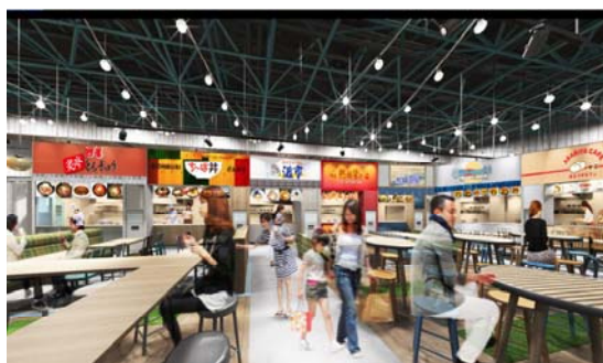
フードコート内（イメージ）

新しいフードコートは、大海原を望む賑やかで活気に溢れる港町をイメージしています。バラエティに富んだ7つの専門店を開店しますので、皆さま是非ご利用ください。なお、グランドオープンについては、平成31年4月下旬を予定しています。