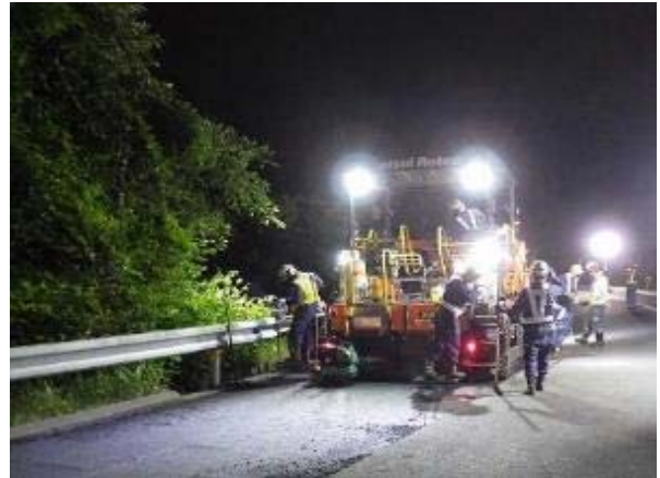
ランプ 舗装補修工事