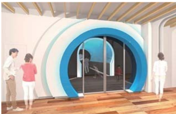
シアター入口 (イメージ)