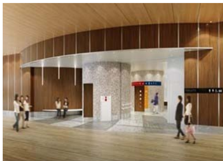
1階トイレ(イメージ)