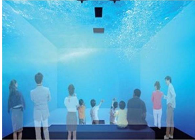
シアタールーム(イメージ)

うみめがね～アクアラインシアター～では、そのような東京湾アクアラインの建設過程等を、建物空間を活用した没入感のある映像でご覧いただけます。