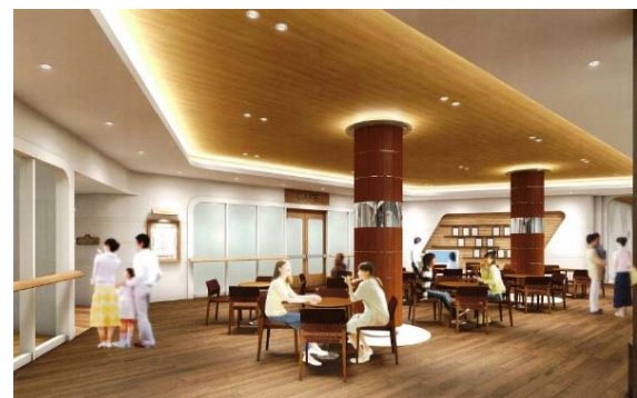
パティオ (イメージ)