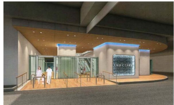
エントランス (イメージ)

今回のリニューアルについては、海ほたるPA1階エントランス及び5階店舗を全面改装いたします。5階通路部は屋内空間へ更新し、荒天時においてもゆったりくつろげる空間へ生まれ変わり、『海に浮かぶ豪華客船がさらにラグジュアリー感あふれる空間』となりますので、是非ご期待ください。