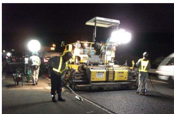
舗装補修工事 作業状況写真