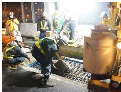
床版部分補修工事 作業状況