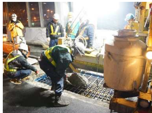
床版部分補修工事 作業状況