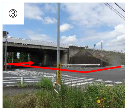
2つ目の信号の「高萩」交差点で右折し、さらに橋を越えた先のすぐの信号を右折します。