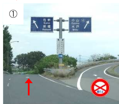
小山方面のランプは閉鎖のため、足利方面（佐野・前橋）のランプに入り、国道 50 号に合流します。