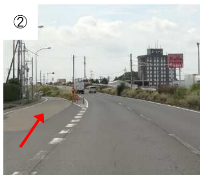
「佐野新都市」交差点を直進し、しばらくすると側道が見えるので側道へお進みください。