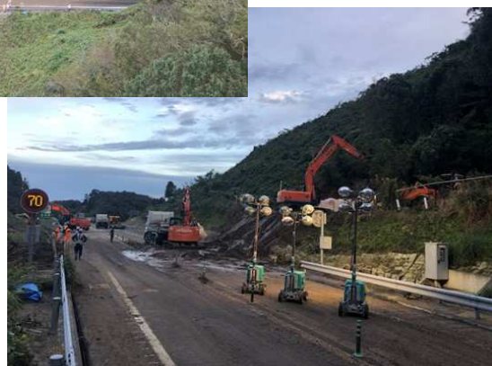
【C4】圏央道 茂原長南 IC～市原鶴舞 IC 間