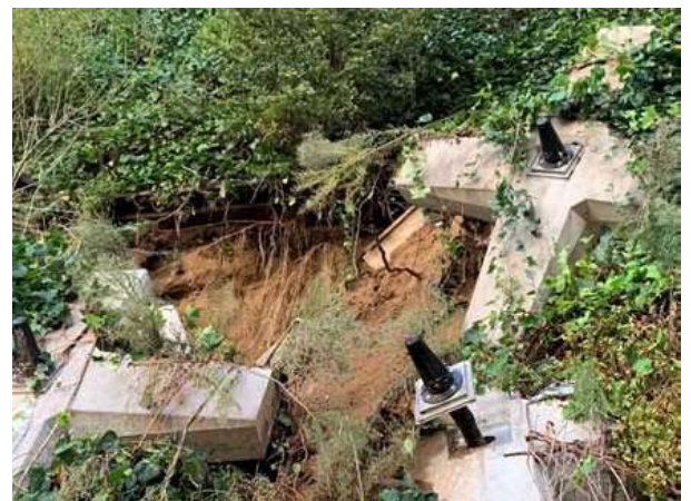
【E82】千葉東金道路 東金 JCT