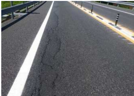
茨城空港北IC～茨城町JCT間 路面損傷状況

そのため、お客さまへ極力ご迷惑をおかけしないよう、交通量が少ない平日の夜間に通行止めを行い、工事を集中的かつ効率的に実施します。安全・快適に高速道路をご利用いただくために必要な工事ですので、ご理解とご協力をお願いします。