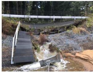
鉾田IC～茨城空港北IC間 災害状況(のり面崩落)