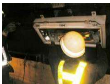
トンネル照明設備清掃・点検

トンネル照明等設備を常時良好な状態に保つための点検・清掃や、交通安全施設の補修を行います。その他、路面清掃や路肩の草刈り作業もあわせて実施します。