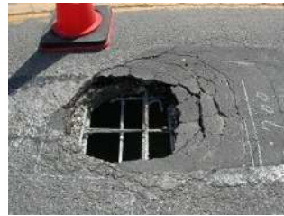
【道路が損傷した例】