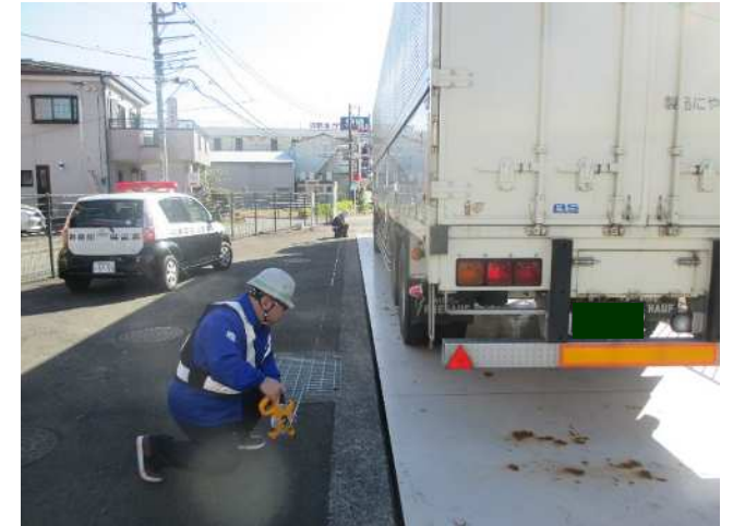
③【相武国道事務所】相模原車両取締基地