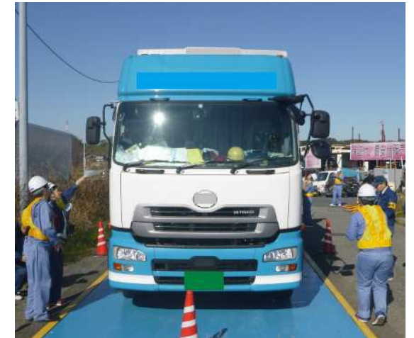
⑥【千葉国道事務所】八千代車両取締基地