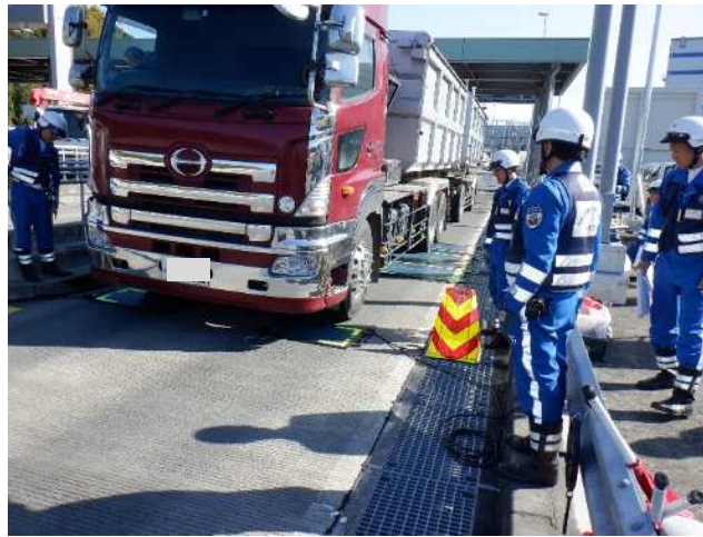
②【中日本高速道路株】相模原愛川IC