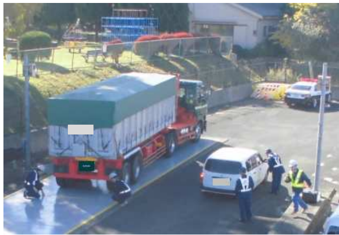
④【大宮国道事務所/埼玉運輸支局】狭山車両取締基地