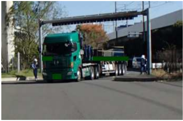
①【東京国道事務所】辰巳車両取締基地