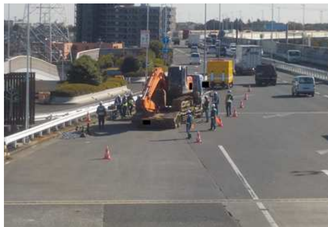
⑤【首都高速道路株】川口本線料金所