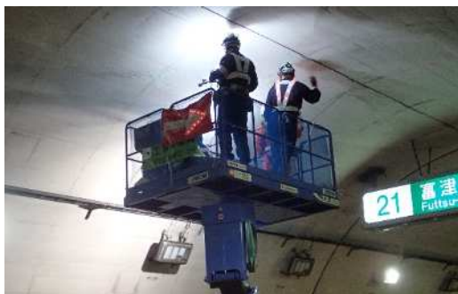
トンネル点検 作業状況

安全・快適に高速道路をご利用いただくために必要な工事ですので、ご理解とご協力をお願いします。