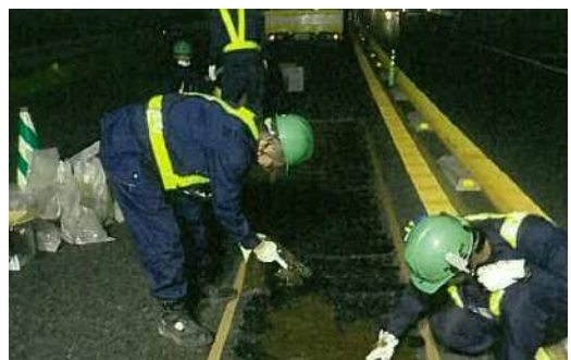
路面補修 作業状況