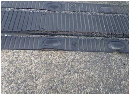
ゴム製伸縮装置の損傷・捲れ

そのため、お客さまへ極力ご迷惑をおかけしないよう、交通量が少ない平日の夜間にランプの閉鎖を行い、工事を集中的かつ効率的に実施します。安全・快適に高速道路をご利用いただくために必要な工事ですので、ご理解とご協力をお願いします。