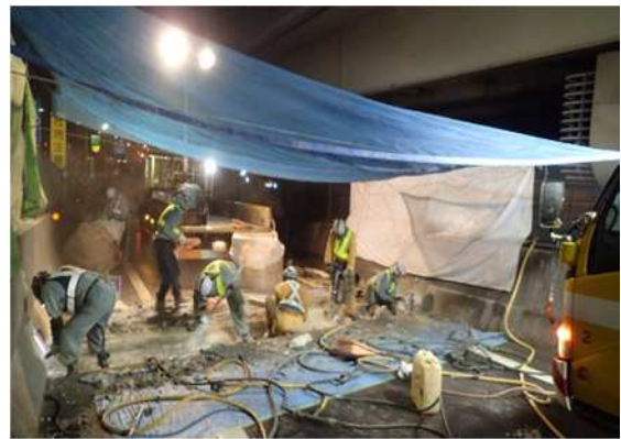
伸縮装置取替工事 作業状況