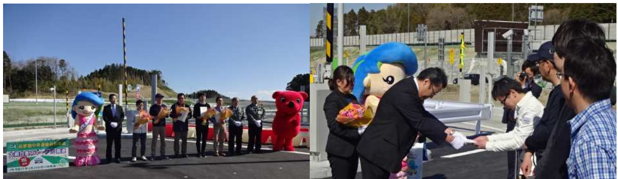
《過去の営業開始セレモニーの様子》(圏央道大網白里スマートIC、平成31年3月)