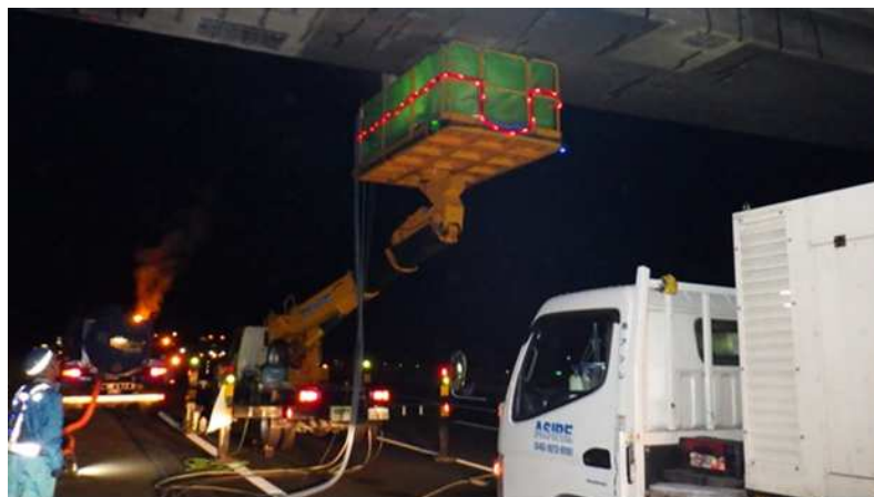
はく落対策工事 作業状況