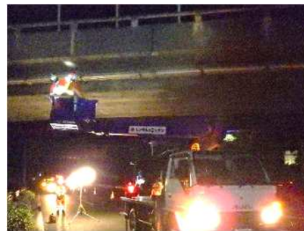
道路構造物の点検