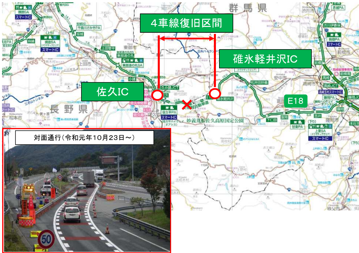
対面通行(令和元年10月23日～)