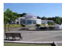
フォッサマグナ ミュージアム