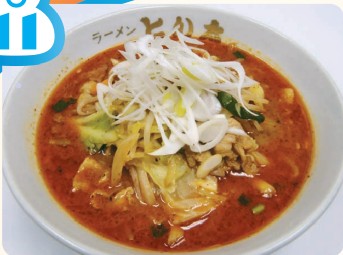
辛辛焼肉味噌らーめん 800円

蓮台寺PA(上り線) スナック ⑩ 7:00～23:00 韓国風焼肉と野菜を乗 せ、ピリッと辛いジャン 油をかけた、ボリューム 満点、寒い冬にぴった りのあったかメニュー です。