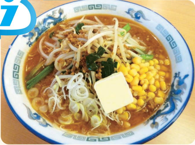
味噌バターラーメン 850円

米山SA(上り線) レストラン ⑩ 12:00～20:00 辛味のある味噌とバターの コクが相性抜群のラメ ンです。寒い冬にぴっ たりのあったかメニュー です。