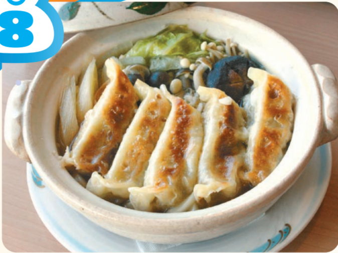
野菜たっぷりぎょうざ鍋焼うどん 850円

米山SA(下り線) レストラン ⑩ 10:00～21:30 熱々の鍋焼きうどんに餃 子が乗ってボリューム満 点! 寒い冬にぴったり のあったかメニューです。