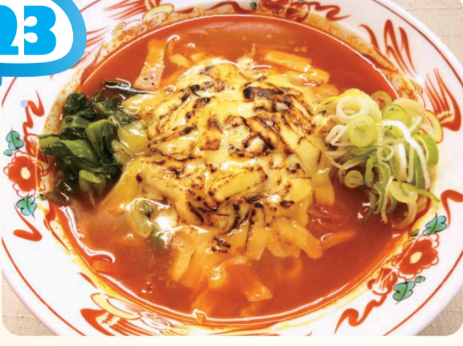
焦がしチーズトマトラーメン 780円

妙高SA(上り線) スナック ⑩ 7:00～20:00 トマトスープ仕立てのト マト麺に焦がしチーズを トッピングした、トマト 満喫のあったかメニ ューです。