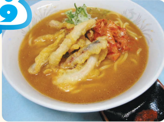
かんずり味噌らーめん 600円

名立谷浜SA(上り線) スナック ⑩ 7:00～21:00 冬の定番「味噌らーめん」 に妙高名産「かんずり」を 入れ、キムチと食べ応え 十分なスル天をトッピン グ、寒い日にピッタリの あったかメニューです。