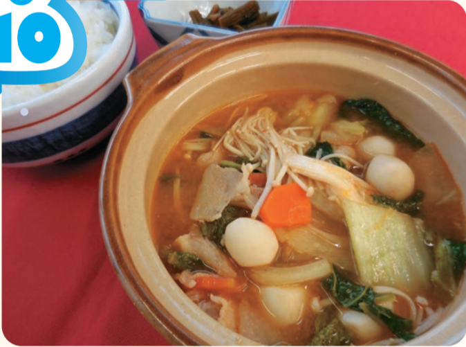
ピリ辛かんずり鍋定食 700円

名立谷浜SA(下り線) スナック ⑩ 7:00～21:00 野菜と県産豚バラ肉の旨 みが溶け込んだかんずり 入り鍋です。丼にご飯を 入れたら2度おいしい、程 よい辛さのあったかメニ ューです。