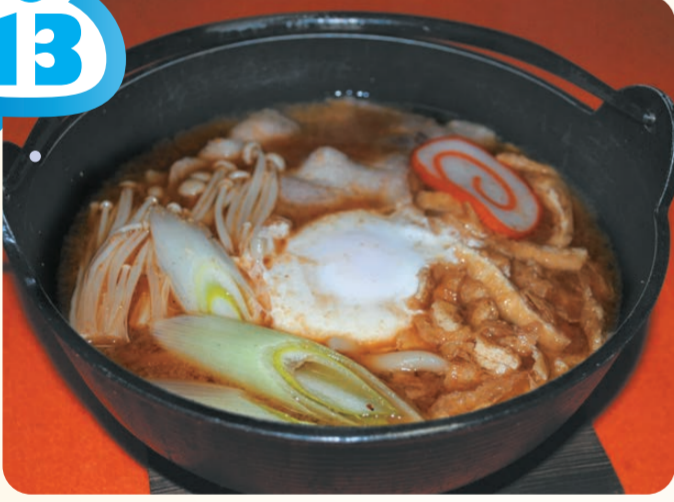
味噌煮込みうどん 600円

越中境PA(上り線) スナック ⑩ 7:30～19:30 濃厚な味噌と「まつやの とり野菜みそ」をブレンド し、まろやかな味に仕上 げた寒い日にピッタリ のあったかメニュー です。