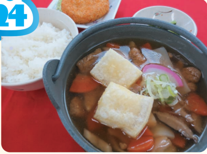
餅・餅・けんちん汁定食 680円

妙高SA(下り線) スナック ⑩ 7:00～20:00 お餅をトッピングしたけ んちん汁は、寒い冬に食 べたくなるあったかメ ニューです。