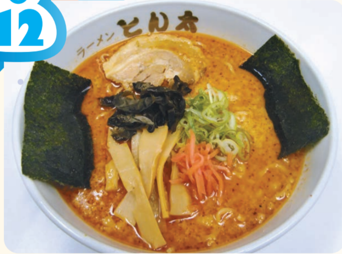
大辛とんこつらーめん 750円

蓮台寺PA(下り線) スナック ⑩ 7:00～23:00 人気のとんこつラーメン に辛いジャン油をかけた 、辛さの中にも背脂の甘 さが感じられるあった かメニューです。