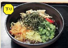
純玄米黒酢スープ冷やし中華 680円