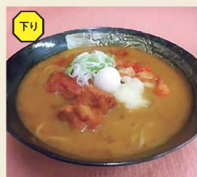
辛味噌スタミナラーメン 780円