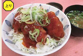
鶏からチリソース丼 780円