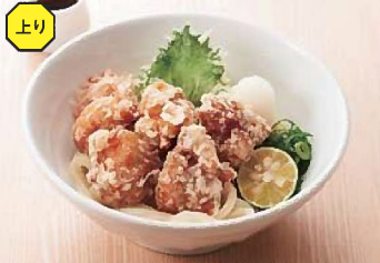
越の鶏の鶏天うどん 880円