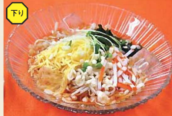
冷やしぶっかけ氷見うどん 700円

24時間、365日、お客さまの件をお照会しています。 NEXCO 東日本 お客さまセンター ☎ 0570-024-024 (24時間) PHS-IP 電話のお客さま: 03-5338-7524