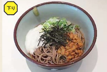
冷やしネバとろそば 580円