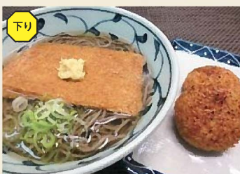
冷やしきつね(そば・うどん)セット 780円