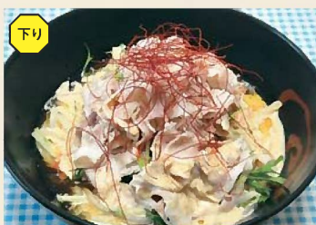
冷しゃぶごまだれうどん 650円