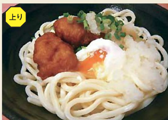
から揚げぶっかけうどん 650円