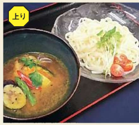
胡麻カレーつけうどん 900円