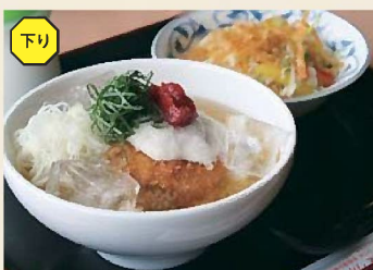
麦酒豚角煮かつ冷しとろろ茶漬 950円