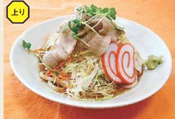
豚の冷しゃぶサラダうどん 650円