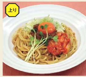
スタミナ中華麺 700円