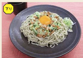
ぶっかけ布のりそば 680円

24時間、365日、お客さまの件をお照会しています。 NEXCO 東日本 お客さまセンター ☎ 0570-024-024 (24時間) PHS-IP 電話のお客さま: 03-5338-7524