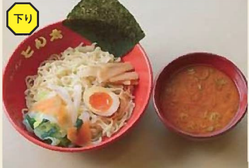
とん太麺ZEROつけ麺 980円