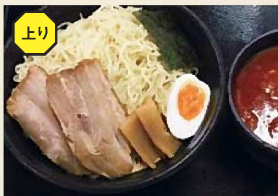
ピリ辛みそつけ麺 「南蛮えび風味」 830円