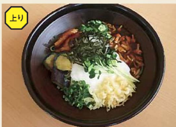
スタミナぶっかけからむしうどん 980円