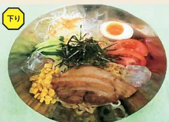
炙りもち豚冷やしサラダ麺 800円