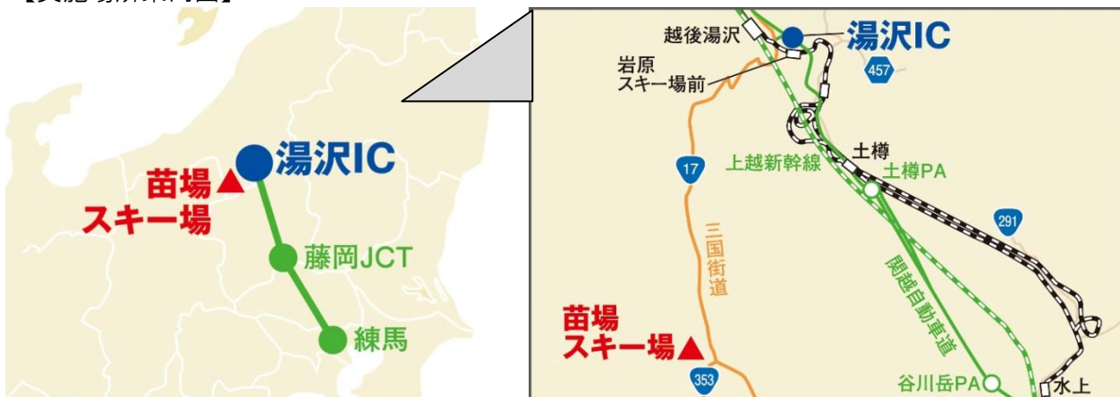
(関越自動車道 湯沢ICから車で平常時約35分)