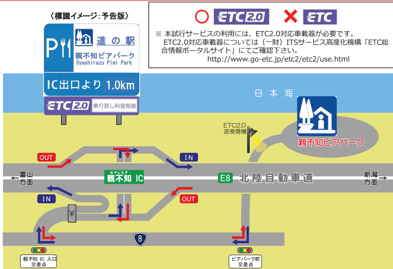
親不知IC～道の駅「親不知ピアパーク」までの標準経路