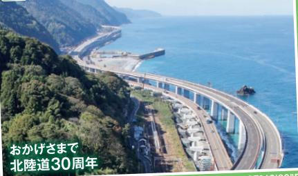
E8 親不知海岸高架橋