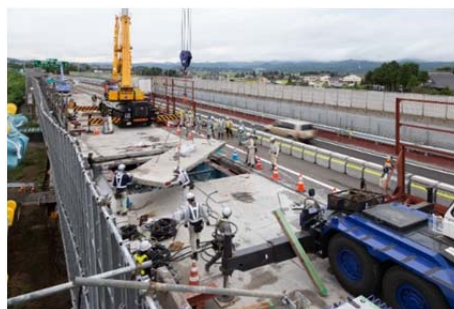
【既設床板の撤去状況】