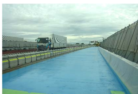
【床版防水(プライマー塗布)の状況】