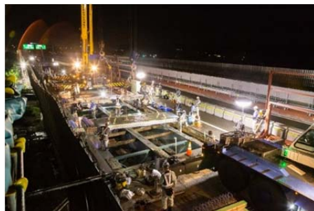
【新設床板の設置状況】