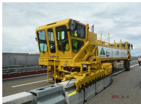
【ロードジッパーシステムによる規制切替】